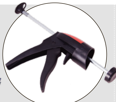
CASCO QUICK GUN