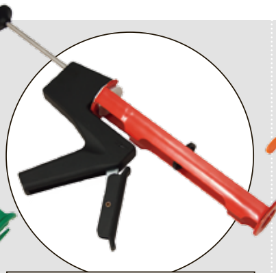
SIKA H 14