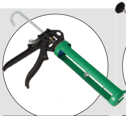
TEC 7 GUM

Betygen på respektive testfaktor är ett medelvärde av testpiloternas betyg. Slutbetyget är en helhetsbedömning som sätts av redaktionen. Där vägs kommentarer och pris in.